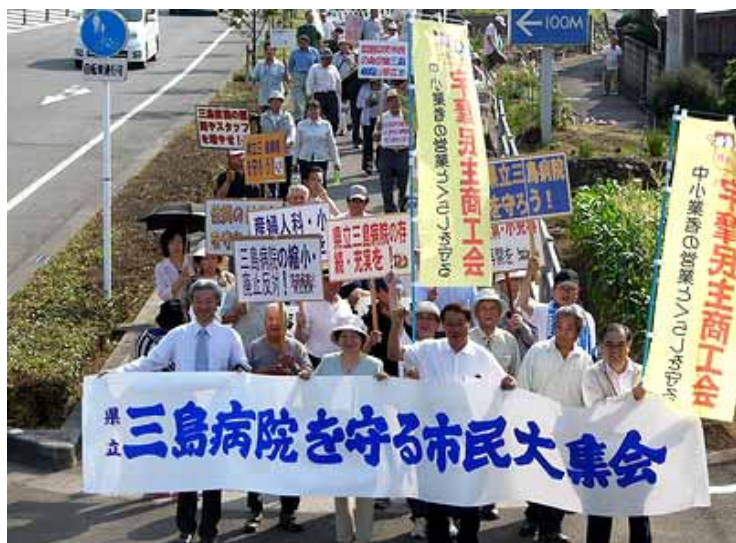
愛媛県立三島病院存続を求める市民集会であいさつした後で行進に参加(6月14日、四国中央市)

して何よりも、後援会員や支持者、党員の方々の温かいご声援が何よりも心の糧になっています。四国各地で山は荒れ、農業がなりたらず農地を放棄せざるを得ない深刻な事態が広がっています。医師不足が地域の医療崩壊を招いており、住民の暮らし、安心・安全の土台が崩されようとしていることに強い憤りを感じています。