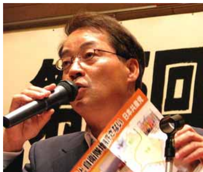
原水禁四国大会で米軍機の低空飛行で特別報告 (6月13日、高松市)

こんにちは、日本共産党四国ブロック国政対策委員長(まさる)です。いよいよ総選挙目前です。私の活動報告をできるだけリアルタイムでお届けしたいと思えます。元気に発信します。ご意見やご感想を気軽にお寄せください。よろしくお祈りします。私は四国4県をまわりはじめて3年4カ月が過ぎ、この間の変化に大きな確信をもっています。特に、経済界や医師会、農林漁業団体、中小工商业者、青年、婦人教育関係者など、精力的に懇談してきました。時にはアポなしでも快く受け入れてくれました。語り合えば「日本共産党との距離がなくなっていく」と痛感する毎日です。「共産党の議席が必要」と激励も。そ