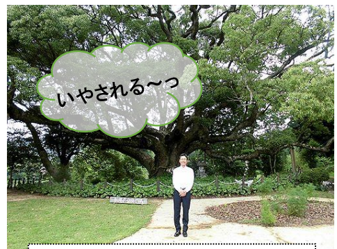
国指定天然記念物・川棚のクスの森